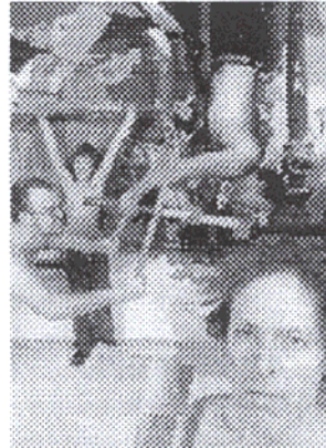
Heuer bei Soho in Ottakring: Götz Bury's Traumfabrik, ein Kunstprojekt in Form eines Fotostudios.

ALLES WIRD SCHÖN 19. Mai bis 02. Juni 2007